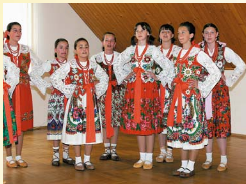
Členky Detského folklórneho súboru Goral