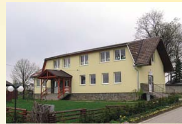
Obnovená materská škola