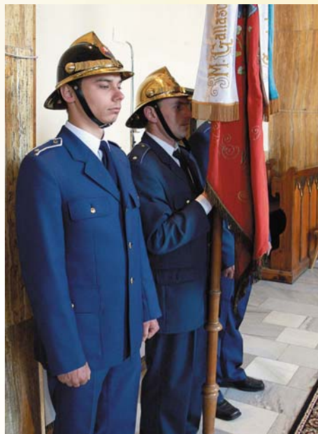
Členovia dobrovoľného hasičského zboru