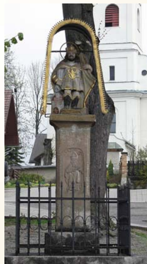
Socha sv. Floriána

V roku 1870 mala Hladovka 613 obyvateľov a 137 domov, v roku 1930 mala 568 obyvateľov a 125 domov, v roku 1940 mala 557 obyvateľov a 137 domov. V roku 1850 prebehla komasácia pôdy. Nastúpilo obdobie hladu, ľudia jedli žihľavu, plevy, slamu mleli na kašu, z čoho vznikol mor. Následkom toho vymrela polovica obyvateľstva a v tom období bol založený aj cholerský cintorín.