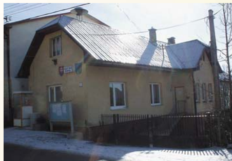
Dočasný obecný úrad v rokoch 1977–2005