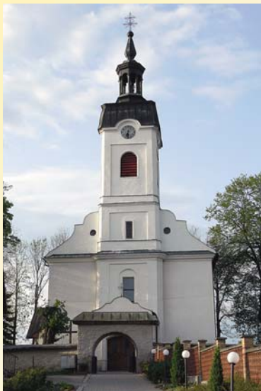
Kostol Nanebovzatia Panny Márie

Nový kostol bol stavaný v rokoch 1800–1806 a v barokovom duchu dokončený v roku 1808. Je zasvätený Nanebovzatiu Panny Márie.