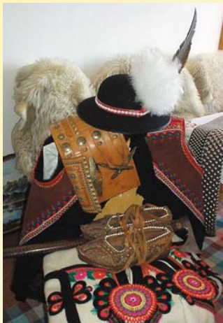
Mužský goralský kroj