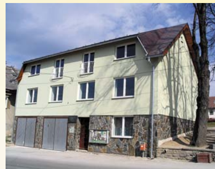
Zrenovovaný obecný úrad a hasičská zbrojnica

V 17. storočí mala Hladovka územné spory so susednou obcou Suchá Hora.