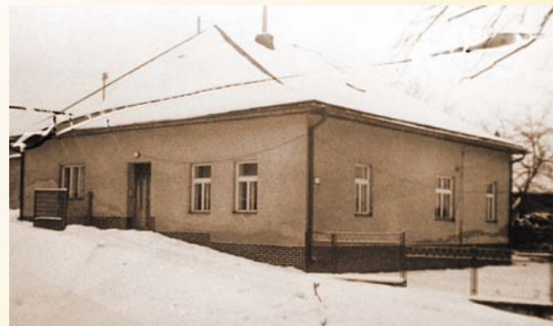
Stará budova fary