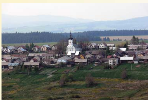
Pohľad na Hladovku z južnej strany

Pri rieke Jelešňa (na dolnom toku, bližšie k dnešnému hraničnému prechodu Trstená – Chyžné) stáli už v roku 1558 dve samoty sedliackych obydlí. V prvých písomných záznamoch