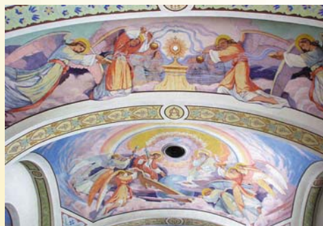
Fresky Jozefa Hanulu na klenbách kostola

S pomocou našich vysťahovalcov v Amerike bol za-