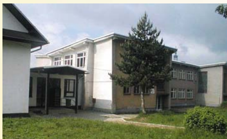
Budova školy s telocvičňou

po maďarsky, do roku 1918 maďarsky i slovensky. V časoch pripojenia obce k Poľsku sa v škole vyučovalo po poľsky (žiaci sa učili poľsky i poľské dejiny). V roku 1949 bola zriadená ne-