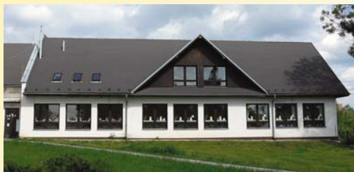
Budova školy, roč. 1. - 4.

po maďarsky, do roku 1918 maďarsky i slovensky. V časoch pripojenia obce k Poľsku sa v škole vyučovalo po poľsky (žiaci sa učili poľsky i poľské dejiny). V roku 1949 bola zriadená ne-