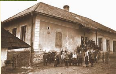
Stará budova školy

úplná stredná škola, v roku 1963 postavená nová škola a byty pre učiteľov. V súčasnosti má škola 14. tried, a navštevuje ju okolo 250 žiakov. Druhý stupeň