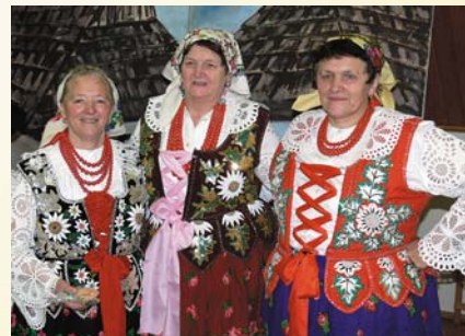
Dlhoročné členky folklórneho súboru Goral

Obyvatelia obce ani dnes na dedičstvo svojich otcov nezabúdajú. Aj dnes môžeme pri rôznych príležitostiach, najmä cirkevných sviatkoch, vidieť mladé dievčatá a ženy vyobliekané v krásnych krojoch kráčať do kostola, či tancovať s mladuchou na svadbe.